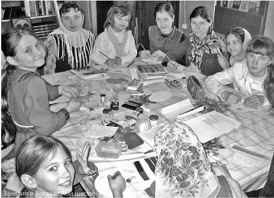
Занятия в Воскресной школе