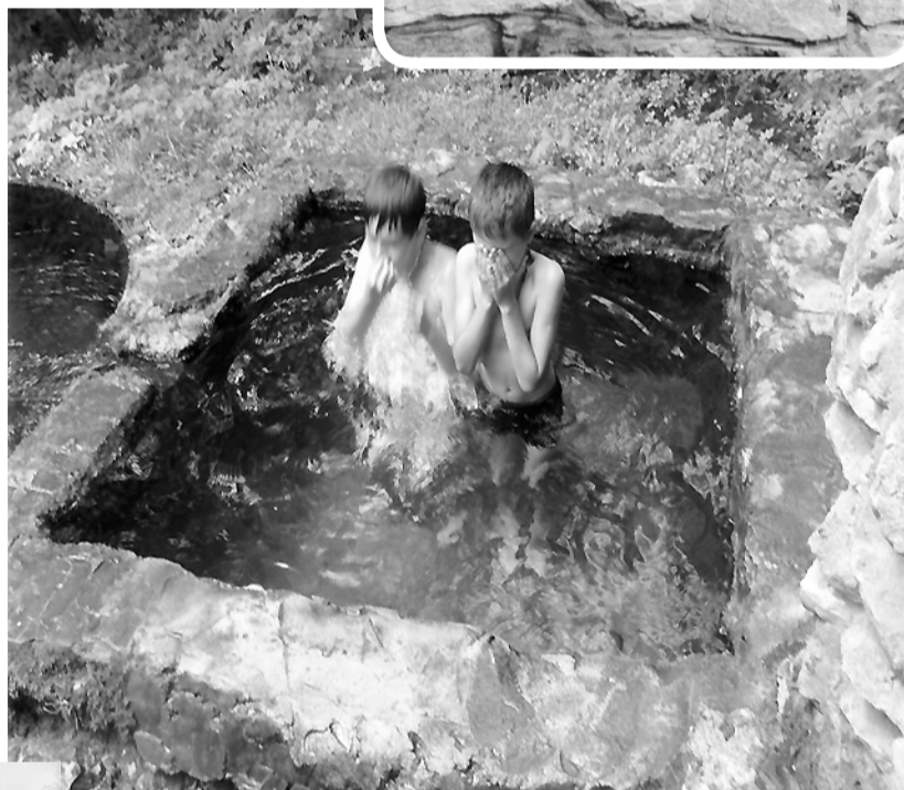
Источник в честь икон Божией Матери «Взыскание погибших» и «Всех скорбящих Радость» в селе Красное.

«Взыскание погибших» и «Всех скорбящих Радость».