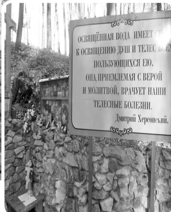
Егнышевский источник в честь святого великомученика и целителя Пантелеймона

«Когда я была маленькой, мама мне читала много разных сказок. Особенно интересными мне казались те сказки, в которых были истории о «живой» и «мертвой» воде. Я подросла, но мне по-прежнему интересно, как же вода может воздействовать на наш организм? Как можно излечить при помощи воды многие заболевания? От мамы я слышала, что святая вода не портится и обладает целебными свойствами. Такой водой по старинным рецептам лечили самые трудные болезни».