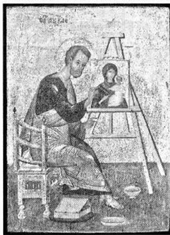
Св. Лука, пишущий Мадонну, неизвестный художник, начало 15 века