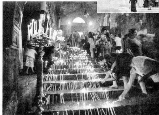
Гробница Богородицы: свечи на ступенях

В начале XII века паломник игумен Даниил впервые описал гробницу Богородицы на русском языке в сочинении «Житие и хождение игумена Даниила из русской земли»: