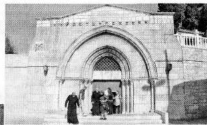
Гефсимания: храм Успения Превятой Богородицы

Гефсимания - святыня святынь христианского мира. Здесь Сын Божий молил до кровавого пота Отца Небесного, дабы миновала его «чаша сия» - стать жертвенным Агнцем. И здесь же была погребена апостолами его земная мать Мария. На этом месте возведена пещерная церковь, одна из немногих подземных в мире.